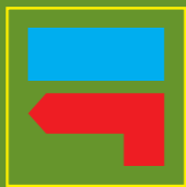
Vire à esquerda Turn Left

Trilho N°04 Trail N°04 TM 04 Trilho Municipal Municipal Trail