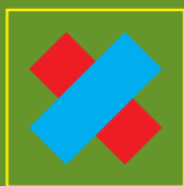
Caminho errado Wrong way