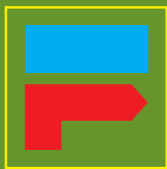
Vire à direita Turn right