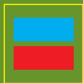
Caminho Certo Right way

Please inform someone that you will be doing this trail, before you start. Please remember to have all the necessary equipments and supplies which you will need. Do not take shortcuts, continue on the identified trail. Do not leave trash on the way. Ribeira Grande's Town Hall, will not be responsible for any occurrence which may take place during your walk.